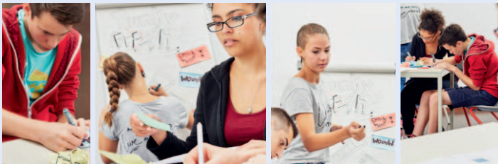
Bsp. PROFIL AC Gruppenaufgabe „Werbeplakat“

Aus einem umfangreichen Aufgabenpool können unterschiedliche Beobachtungsaufgaben in Form von handlungsorientierten Einzel- und Gruppenaufgaben für die Kompetenzanalyse ausgewählt werden. Der Aufgabenpool besteht aus Diskussions-, Produktions-, Problemlöse-, Planungs- und Präsentationsaufgaben. Die Aufgaben sind dabei so konstruiert, dass sie die Potenzialentfaltung unterstützen und so der Beobachtung zugänglich gemacht werden. Die Beobachtungsaufgaben dienen der Erfassung der Sozial-, Methoden- und Personalen Kompetenz sowie der Fachlichen Basiskompetenz.