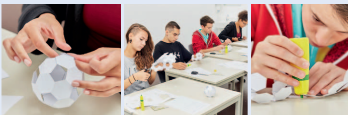
PROFIL AC Einzelaufgabe „Eckball“

Klare und verständliche Aufgabeninstruktionen für AnwenderInnen und Teilnehmende sichern eine einfache Durchführung.